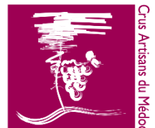
Crus Artisans du Médoc

Contact(s) +33 5 56 59 03 08 / +33 5 56 59 00 85 -